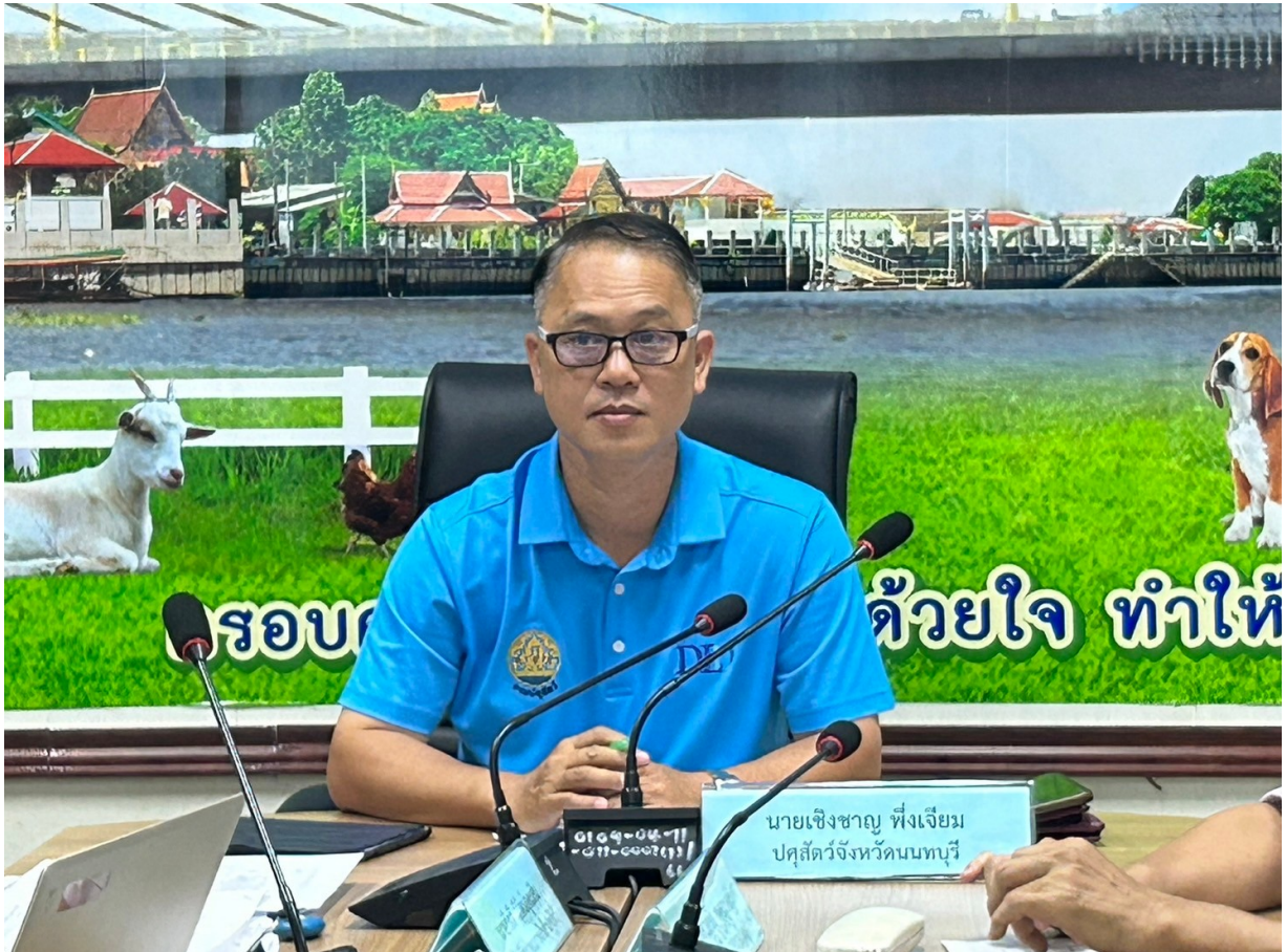
ประธานการประชุม นายสัตวแพทย์เชิงชาย ฝั่งเจียม ปศุสัตว์จังหวัดนนทบุรี