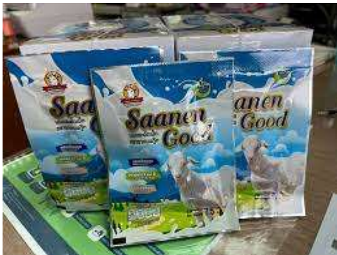
บรรจุภัณฑ์เดิม

1. พัฒนาปรับปรุงบรรจุภัณฑ์และเปลี่ยนชื่อแบรนด์ของผลิตภัณฑ์นมแพะอัดเม็ด จาก Saanen Goat เป็น Racha Goat Milk (ราชานมแพะ)