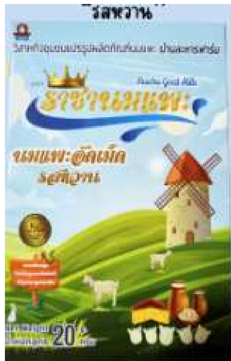
บรรจุภัณฑ์ใหม่