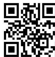
13.6 แบบประเมินการประชุมสัมมนา