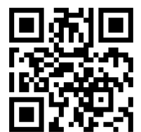
13.4 แบบรายงานผลการ ปฏิบัติงาน (OTOP)