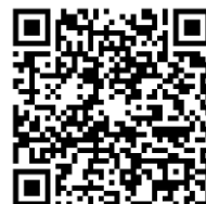
13.3 แบบบันทึก ข้อมูลผลิตภัณฑ์