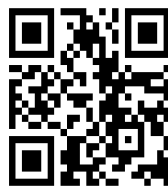
13.2 แบบประเมินการฝึกอบรมเกษตรกร