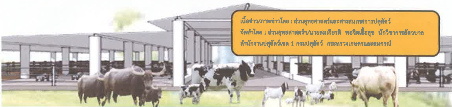
เมื่อข่าว/ภาพข่าวโดย : ส่วนยุทธศาสตร์และสารสนเทศการปศุสัตว์ จัดทำโดย : ส่วนยุทธศาสตร์/นายสมเกียรติ พงศ์เจื้อยสุข นักวิชาการสัตวบาล สำนักงานปศุสัตว์เขต 1 กรมปศุสัตว์ กระทรวงเกษตรและสหกรณ์